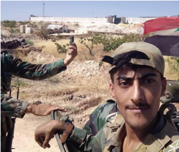
Morek Türk Gözlem Noktası önünde görüntü kaydeden bir rejim askerî 4

► Suriye Arap Silahlı Kuvvetleri, Morek gözlem noktasının ikmal hatlarını keserek ilgili sahadaki Türk askeri birliğini fiilen izole etmiştir. Gözlem noktasında konuşlu unsurlar şu ana kadar herhangi bir saldırıya maruz kalmasa da, ikmal hattını açık tutmak ve gerekirse ileri konuşlandırılmış personeli tahliye etmek Ankara için problematik konulardır. Ayrıca, Suriye Arap Silahlı Kuvvetleri birlikleri Morek gözlem noktasına tehlikeli bir mesafede – birkaç yüz metreye kadar yakın – konumlanmış durumdadır. Sosyal medyadan elde edilen görüntüler, beraberlerindeki ana muharebe tankı ile Morek'teki Türk gözlem noktasının önünden geçen küçük bir Suriye müfrezesini göstermektedir 3 . Kuşkusuz, bu kadar bulanık temas hatları ve çok dinamik operasyon alanı parametreleri, taktik düzeydeki basit hataları veya yanlış anlaşılması politik-askeri tırmanmalara çevirebilecektir.